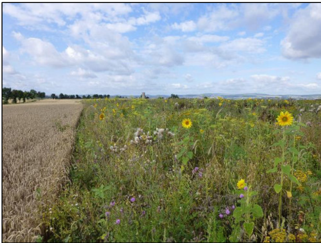
Foto: Artenreicher Blühstreifen mit angrenzendem Getreide.