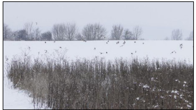
Foto: Blühstreifen im Winter bieten Deckung und Sicherheit.