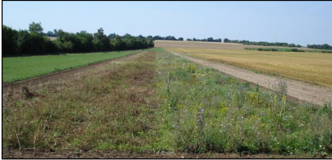
Anlage eines Blühstreifens mit Schwarzbrache (links).