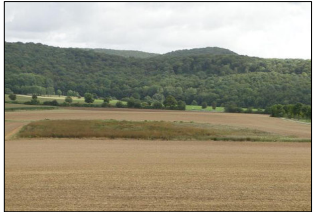
Foto: Mittig im Feld platzierte Blühfläche. (Archiv Rebhuhnprojekt Göttingen: BEEKE & GOTTSCHALK).