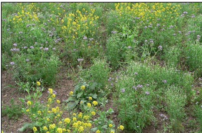
Foto: Frisch ausgesäeter Teil; viele offenere Bereiche für Küken nutzbar.