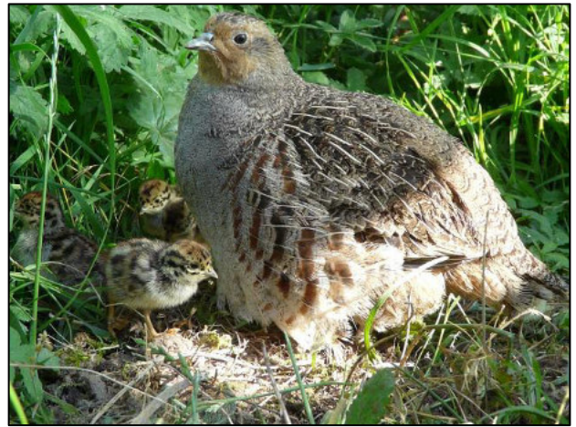
Henne mit Küken.

Das Rebhuhn ist ein ausgeprägter Standvogel, der nur in Ausnahmefällen weitere Strecken zurücklegt. Im Winter bilden die Rebhuhnfamilien sog. Ketten. Im Frühjahr bilden sich aus diesen Ketten heraus Paare. Nach vorausgegangener Rufbalz der Männchen werden Reviere abgegrenzt. Das Nest wird in dichter Vegetation angelegt. Die flüggen Küken sind zwingend auf locker bewachsene Bereiche angewiesen (Nahrungssuche/Gefiedertrocknung).