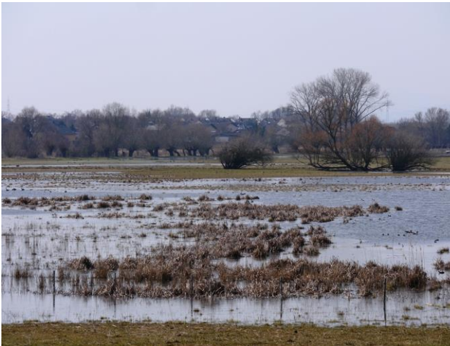
Ursprünglicher Brutplatz in Flachwasser- und Verlandungszonen überfluteter Auen