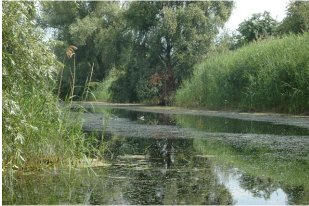
Typischer Lebensraum mit ausgedehnter Verlandungszone und ausgeprägter Schwimm- und Tauchblattvegetation in einer alten Materialentnahmestelle