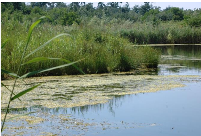
Junge Gewässer wie dieses in einer Kiesgrube werden ebenfalls regelmäßig besiedelt