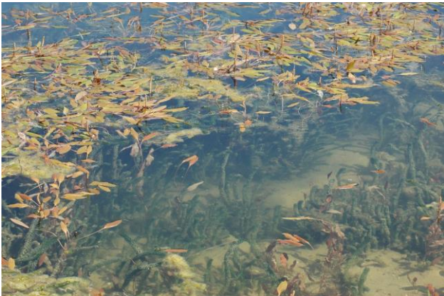
Detailaufnahme einer optimal ausgeprägten Schwimm- und Tauchblattvegetation