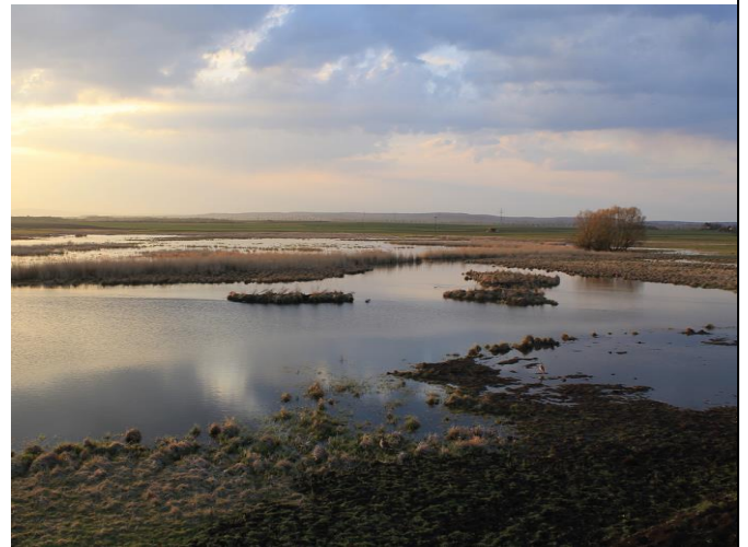
Abb.3: Lebensraum der Knäkente im NSG „Bingenheimer Ried“