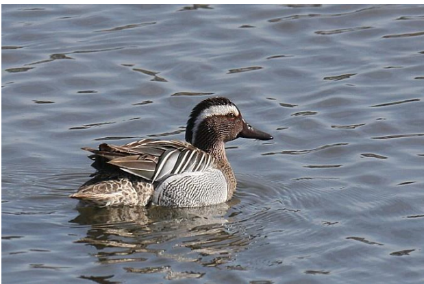
Abb. 1: Knäkerpel ( Anas querquedula )

Als Beitrag zur Erreichung von Ziel 1 der Hessischen Biodiversitätsstrategie „Die Verschlechterung der relevanten Natura 2000-Lebensräume und –arten wird gestoppt und eine Verbesserung des Erhaltungszustands erreicht“, und von Ziel 2 „Arten für die Hessen eine besondere Verantwortung hat, sind gesichert und können sich wieder ausbreiten“ sehen die Aktionspläne die Erarbeitung praxistauglicher Artenhilfskonzepte vor. Für die Knäkente wurde ein solches Artenhilfskonzept noch nicht erstellt, so dass das vorliegende Maßnahmenblatt, das auf Experteneinschätzungen beruht, lediglich vorläufigen Charakter hat.