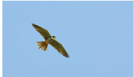
Adulter Baumfalke

geführt hat. Auch bei den Bruten auf Hochspannungsmasten geht eine vermutete Bestandszunahme mit einer gezielten Nachsuche bei Leitungstrassen einher (z.B. in Sachsen, zum Teil mit Hilfe von Hubschrauberflügen).