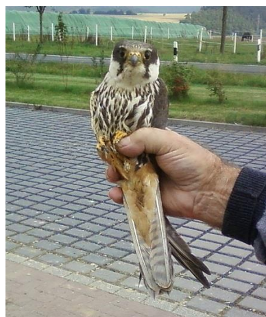
Baumfalke nach Flugunfall in Reithalle; Brutplatz: Wald-ecke rechts oben im Hintergrund

Die Jagdflüge des Baumfalken bei der Verfolgung von Beutevögeln erfolgen – sperbergleich - oft inmitten von Ortschaften im ungestümen Tiefflug zwischen Häusern, Freileitungen und anderen Hindernissen. Die Gefahr von Flugunfällen ist dabei groß. So verflieg sich ein Baumfalke bei der Schwalbenjagd in eine Reithalle; der Vogel konnte eingefangen und gerettet werden. Insbesondere stellt sich das Problem des Anflugs an Glasscheiben. Maßnahmen zur Sichtbarmachung von großen Glasscheiben sind Hauseigentümern dringend zu empfehlen.