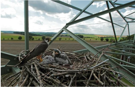
Brut auf Hochspannungsmast