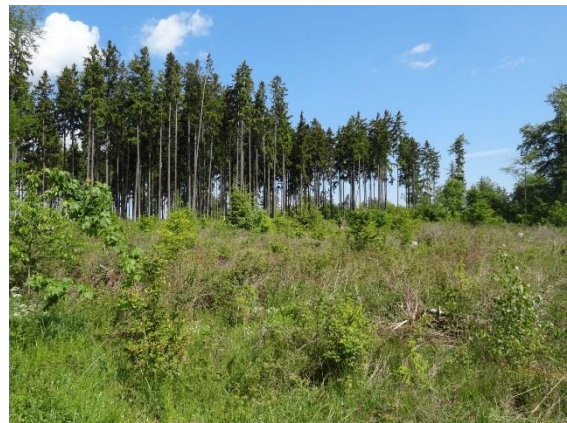
Bruthabitat des Baumfalken vom Typus „Windwurf-Insel“

oder streifenartige Struktur. In Waldgebieten bieten diese offene Waldränder, insbesondere durch Windwurf aufgerissene Bestände, mit locker stehenden Gruppen von Restbäumen sowie Waldecken oder –spitzen, die in das Offenland hineinragen. Eine ähnliche Struktur können Hangwälder aufweisen, die an der Hangkante an Offenland grenzen. Der „Windwurftypus“ betrifft überwiegend Nadelholzbestände; in Frage kommen aber auch Gruppen von Laubholzüberhältern. Es reicht aus, wenn die genannten Strukturen sich aus den umgebenden Waldflächen inselartig herausheben. Auch mehr oder weniger geschlossene Waldränder können gelegentlich als Brutplatz dienen, wenn dort Gruppen hoher Einzelbäume wie Lärchen, Fichten, Kiefern oder Douglasien herausragen und eine exponierte Kulisse bilden. Einförmig dichte und geschlossene Waldbestände scheiden dagegen als Brutbiotop aus.